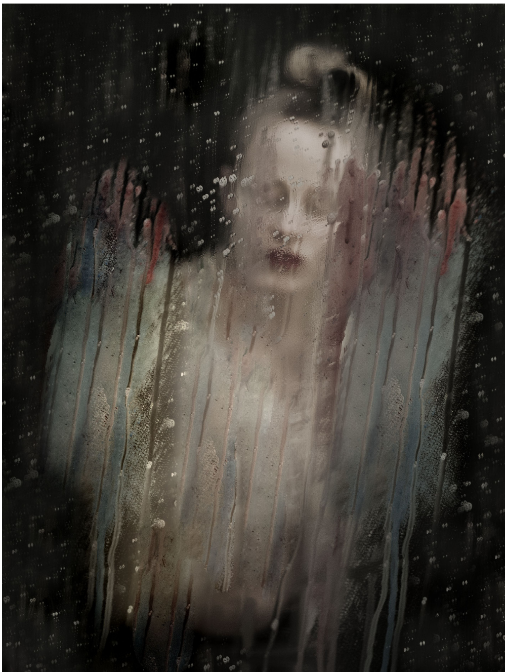
DIVA , 2014, tirage pigmentaire sur papier hahnemuhle rag baryta contrecollé sur aluminium, 60*80